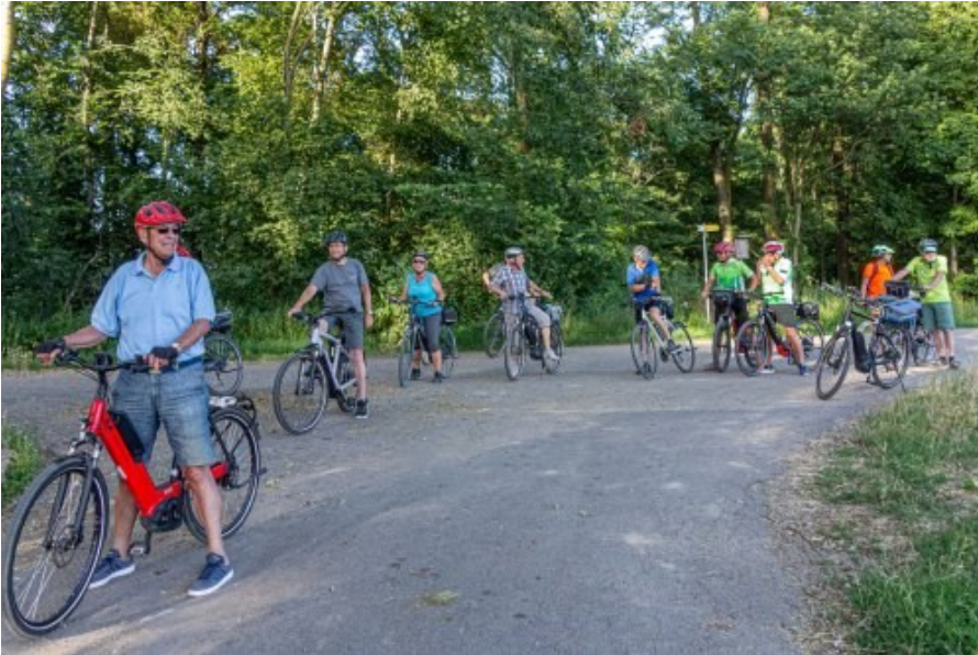
Über dem Eisenbahntunnel aus dem Heilbronner Stadtwald heraus

Hier bot sich erneut ein imposanter Blick auf Heilbronn im Vordergrund sowie die Ketten von Heuchel- und Stromberg im Hintergrund.