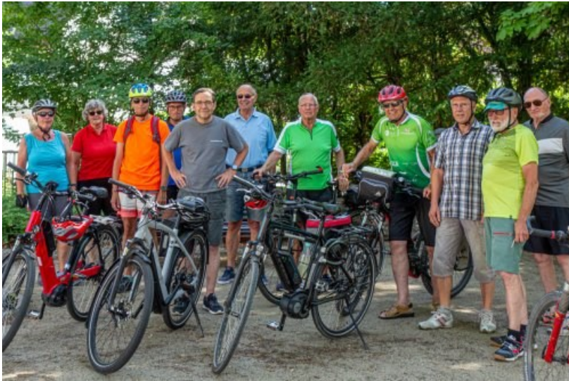
Start am Talheimer Rathausplatz

Bei angenehmen Radfahrtemperaturen fanden sich 11 Radler auf dem Rathausplatz in Talheim.