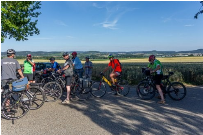
Trinkpause mit Blick auf Helfenberg, Beilstein und Wunnenstein

Am Frankelbach entlang begann die Tour und führte über den „Lauftreff“ in den Ilfelder Gemeindewald zu den Engelsberghöfen. Auf dem Weg nach Donnbronn konnte eine tolle Aussicht auf Burgen und Berge des Schwäbischen Waldes genossen werden.