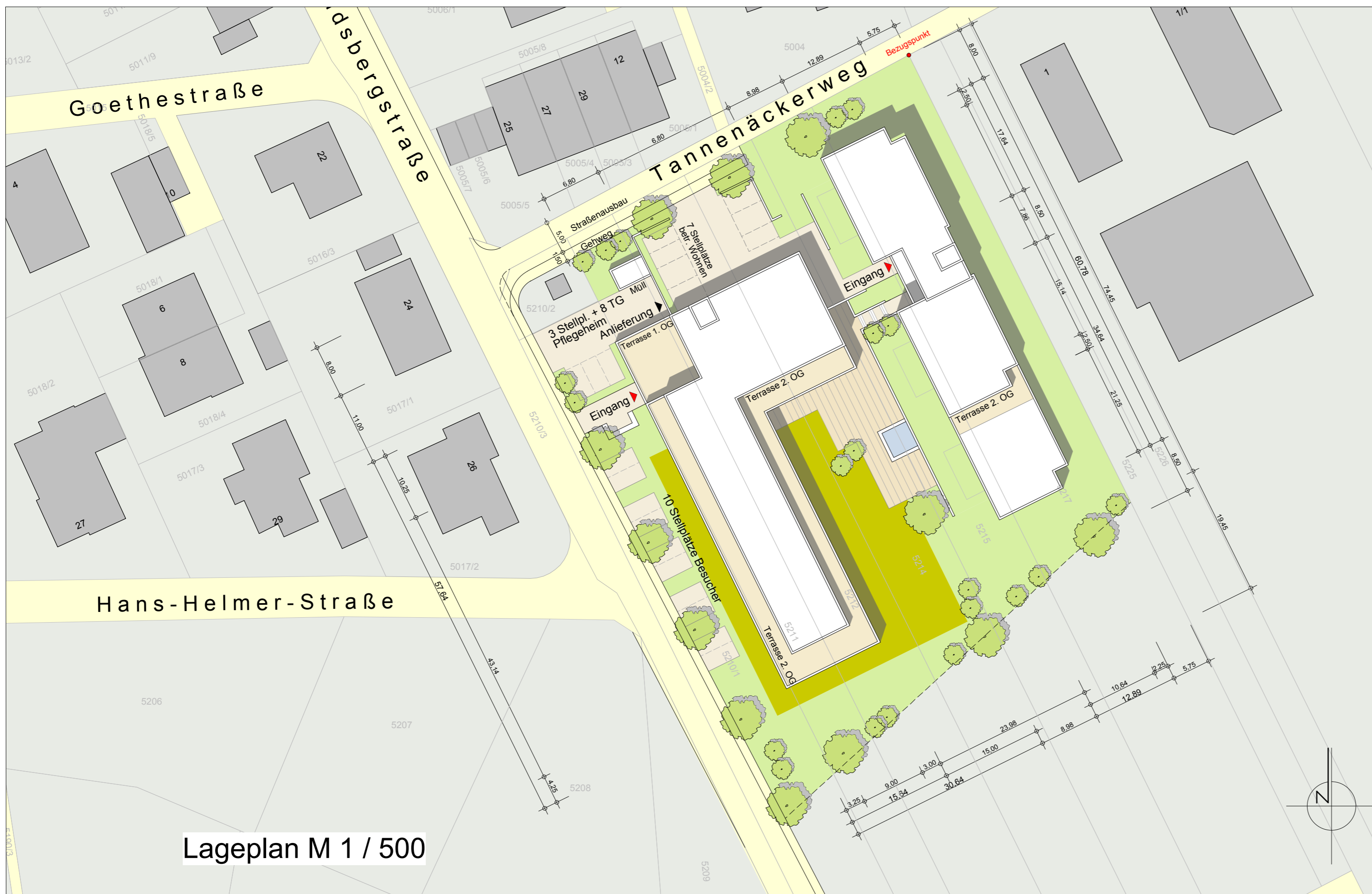
Lageplan M 1 / 500